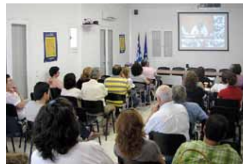
Άποψη από το γραφείο της Μήλου

Η πρώτη πρωτοβουλία αφορούσε σε ένα σύστημα ενίσχυσης της ρευστότητας και επιτάχυνσης της κυκλοφορίας για την συγκράτηση του χρήματος στην τοπική